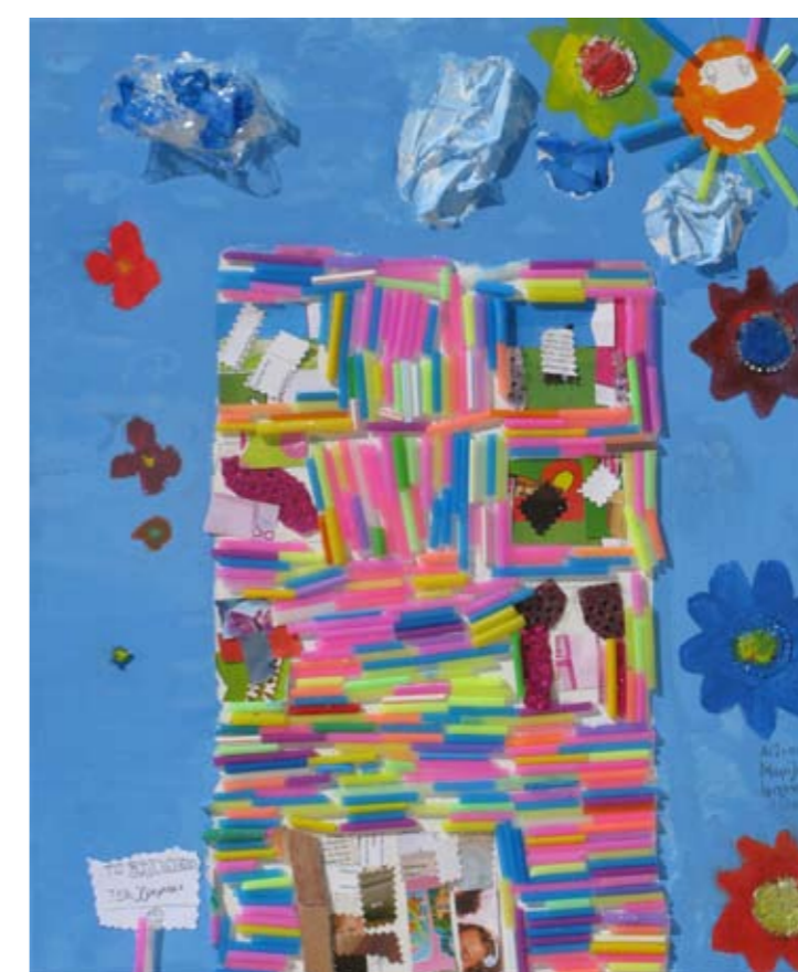
■ Εργαστήριο Ειδικής Επαγγελματικής Εκπαίδευσης και Κατάρτισης Ηρακλείου - Αττικής (ΕΕΕΕΚ Ηρακλείου) / Ελληνογερμανική Αγωγή ■ Special Vocational and Training Workshops - Iraklio Attikis / Ellinogermaniki Agogi