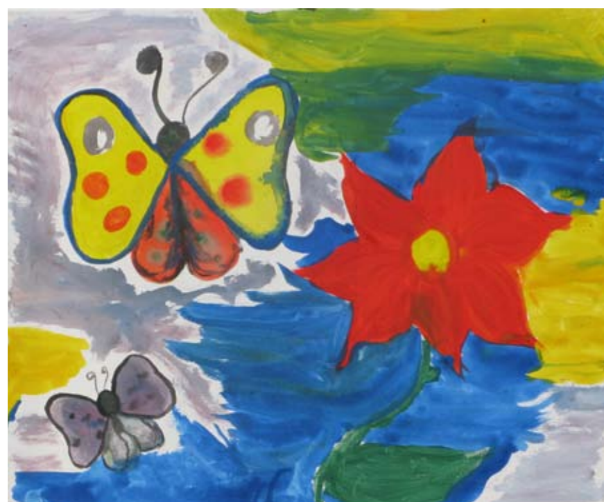
■ Εργαστήριο Ειδικής Επαγγελματικής Εκπαίδευσης και Κατάρτισης Γαλατά (ΕΕΕΕΚ Γαλατά) / Καλλιτεχνικό Γυμνάσιο Γέρακα / Το Χαμόγελο του Παιδιού/ Γυμνάσιο Γαλατά ■ Technical Vocational Educational School of Galatas / Secondary Art School of Gerakas / The Smile of the Child / Junior High School of Galatas