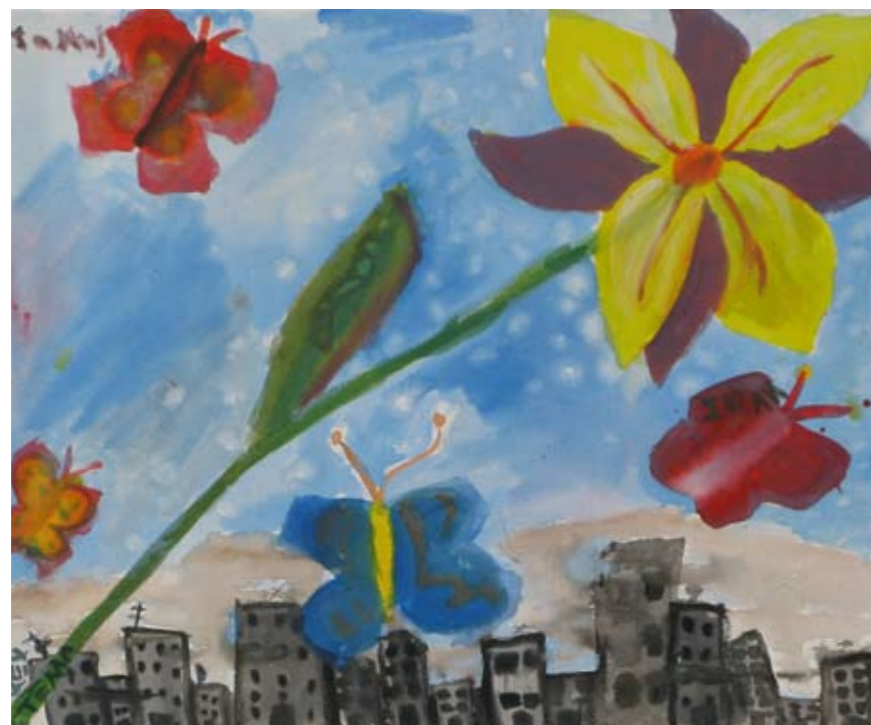
■ Εργαστήριο Ειδικής Επαγγελματικής Εκπαίδευσης και Κατάρτισης Γαλατά (ΕΕΕΕΚ Γαλατά) / Καλλιτεχνικό Γυμνάσιο Γέρακα / Το Χαμόγελο του Παιδιού/ Γυμνάσιο Γαλατά ■ Technical Vocational Educational School of Galatas / Secondary Art School of Gerakas / The Smile of the Child / Junior High School of Galatas