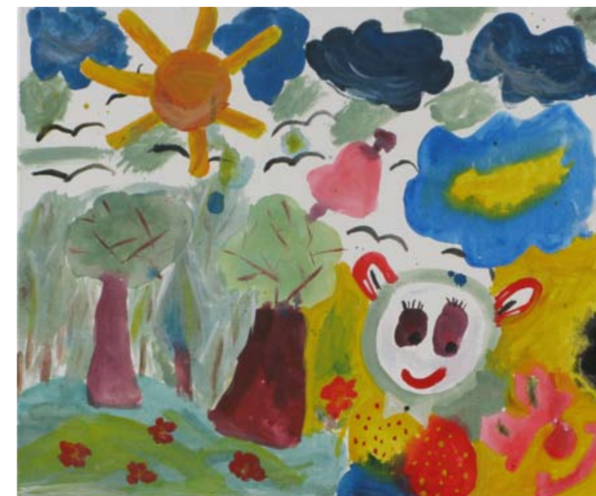
■ Εργαστήριο Ειδικής Επαγγελματικής Εκπαίδευσης και Κατάρτισης Ηρακλείου - Αττικής (ΕΕΕΕΚ Ηρακλείου) / Γυμνάσιο Πόρου / Εργαστήριο Ειδικής Επαγγελματικής Εκπαίδευσης και Κατάρτισης Γαλατά (ΕΕΕΕΚ Γαλατά) / Εκπαιδευτήρια Δούκα ■ Special Vocational and Training Workshops - Iraklio Attikis / Junior High School of Poros / Technical Vocational Educational School of Galatas / Doukas School