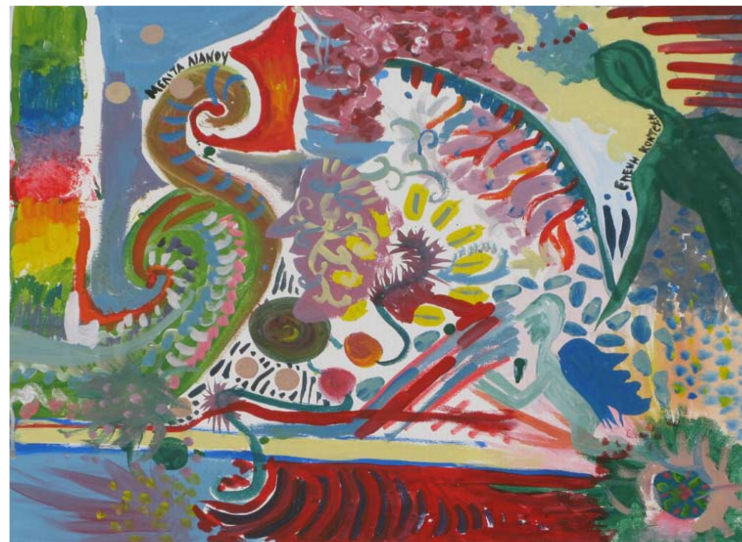
■ ΙΠΕΚΒΕ – Ίδρυμα Πρόνοιας και Εκπαίδευσης Κωφών και Βαρήκων Ελλάδος / Λεόντειο Λύκειο Νέας Σμύρνης / Εργαστήριο Ειδικής Επαγγελματικής Εκπαίδευσης και Κατάρτισης Αγίου Δημητρίου (ΕΕΕΕΚ Αγίου Δημητρίου) / Ελληνογερμανική Αγωγή ■ The Foundation for the Welfare and Education of the Deaf and Hard of Hearing Greece (IPEKVE) / Leontio High School of Nea Smirni / Special Vocational and Training Workshops – Agiou Dimitriou / Ellinogermaniki Agogi