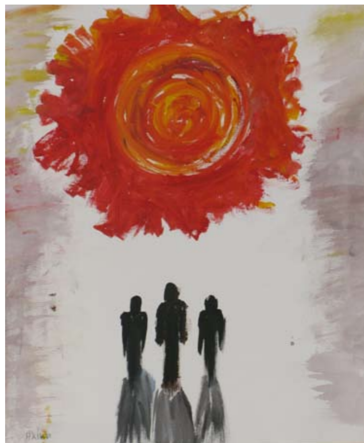
■ ΙΠΕΚΒΕ – Ίδρυμα Πρόνοιας και Εκπαίδευσης Κωφών και Βαρήκων Ελλάδος / Λεόντειο Λύκειο Νέας Σμύρνης / Εργαστήριο Ειδικής Επαγγελματικής Εκπαίδευσης και Κατάρτισης Αγίου Δημητρίου (ΕΕΕΕΚ Αγίου Δημητρίου) / Ελληνογερμανική Αγωγή ■ The Foundation for the Welfare and Education of the Deaf and Hard of Hearing Greece (IPEKVE) / Leontio High School of Nea Smirni / Special Vocational and Training Workshops – Agiou Dimitriou / Ellinogermaniki Agogi