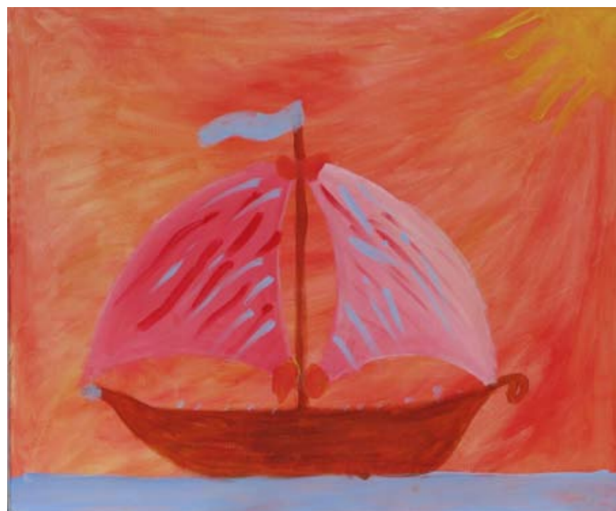
■ ΤΕΕ Ειδικής Αγωγής – Ειδικό ΕΠΑΛ Σερρών / 4ο Γυμνάσιο Σερρών ■ Technical Vocational Educational School of Serres / 4th Junior High School of Serres