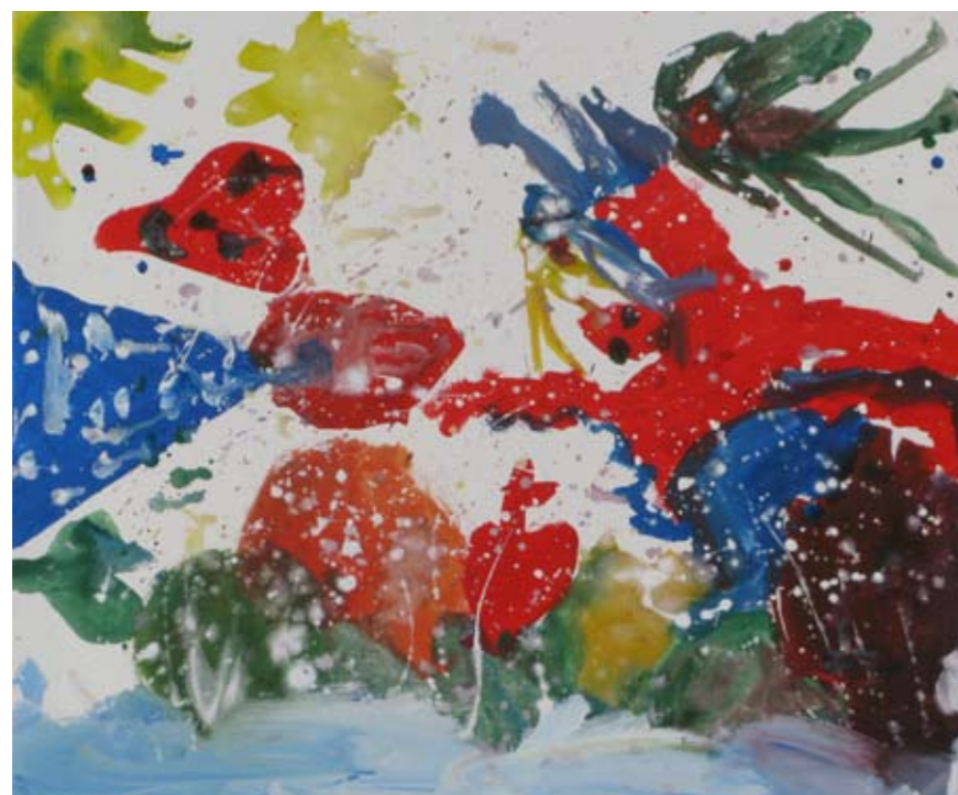
■ Εργαστήριο Ειδικής Επαγγελματικής Εκπαίδευσης και Κατάρτισης Ηρακλείου - Αττικής (ΕΕΕΕΚ Ηρακλείου) / Γυμνάσιο Πόρου / Εργαστήριο Ειδικής Επαγγελματικής Εκπαίδευσης και Κατάρτισης Γαλατά (ΕΕΕΕΚ Γαλατά) / Εκπαιδευτήρια Δούκα ■ Special Vocational and Training Workshops - Iraklio Attikis / Junior High School of Poros / Technical Vocational Educational School of Galatas / Doukas School