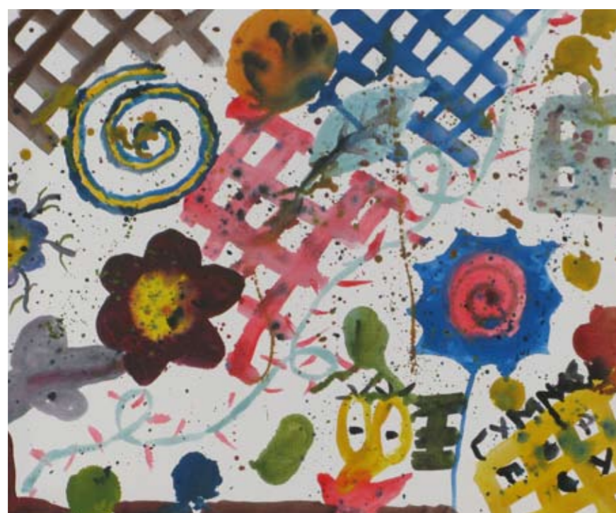
■ Εργαστήριο Ειδικής Επαγγελματικής Εκπαίδευσης και Κατάρτισης Ηρακλείου - Αττικής (ΕΕΕΕΚ Ηρακλείου) / Γυμνάσιο Πόρου / Εργαστήριο Ειδικής Επαγγελματικής Εκπαίδευσης και Κατάρτισης Γαλατά (ΕΕΕΕΚ Γαλατά) / Εκπαιδευτήρια Δούκα ■ Special Vocational and Training Workshops - Iraklio Attikis / Junior High School of Poros / Technical Vocational Educational School of Galatas / Doukas School