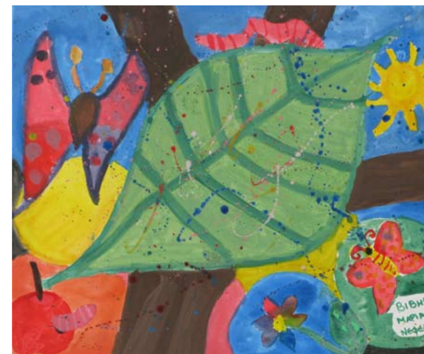
■ Εργαστήριο Ειδικής Επαγγελματικής Εκπαίδευσης και Κατάρτισης Γαλατά (ΕΕΕΕΚ Γαλατά) / Καλλιτεχνικό Γυμνάσιο Γέρακα / Το Χαμόγελο του Παιδιού/ Γυμνάσιο Γαλατά ■ Technical Vocational Educational School of Galatas / Secondary Art School of Gerakas / The Smile of the Child / Junior High School of Galatas