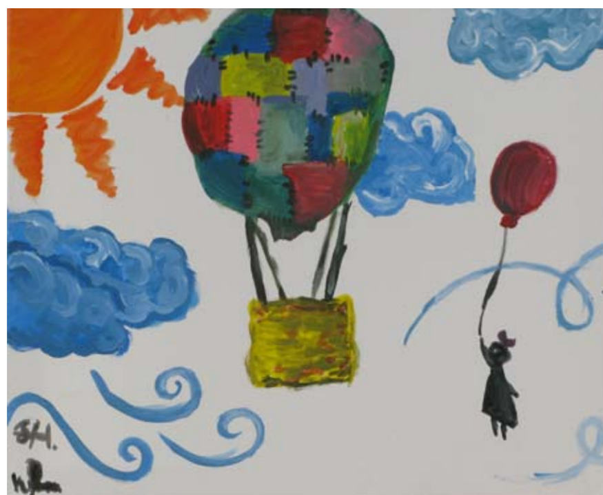
■ ΙΠΕΚΒΕ – Ίδρυμα Πρόνοιας και Εκπαίδευσης Κωφών και Βαρήκων Ελλάδος / Λεόντειο Λύκειο Νέας Σμύρνης / Εργαστήριο Ειδικής Επαγγελματικής Εκπαίδευσης και Κατάρτισης Αγίου Δημητρίου (ΕΕΕΕΚ Αγίου Δημητρίου) / Ελληνογερμανική Αγωγή ■ The Foundation for the Welfare and Education of the Deaf and Hard of Hearing Greece (IPEKVE) / Leontio High School of Nea Smirni / Special Vocational and Training Workshops – Agiou Dimitriou / Ellinogermaniki Agogi