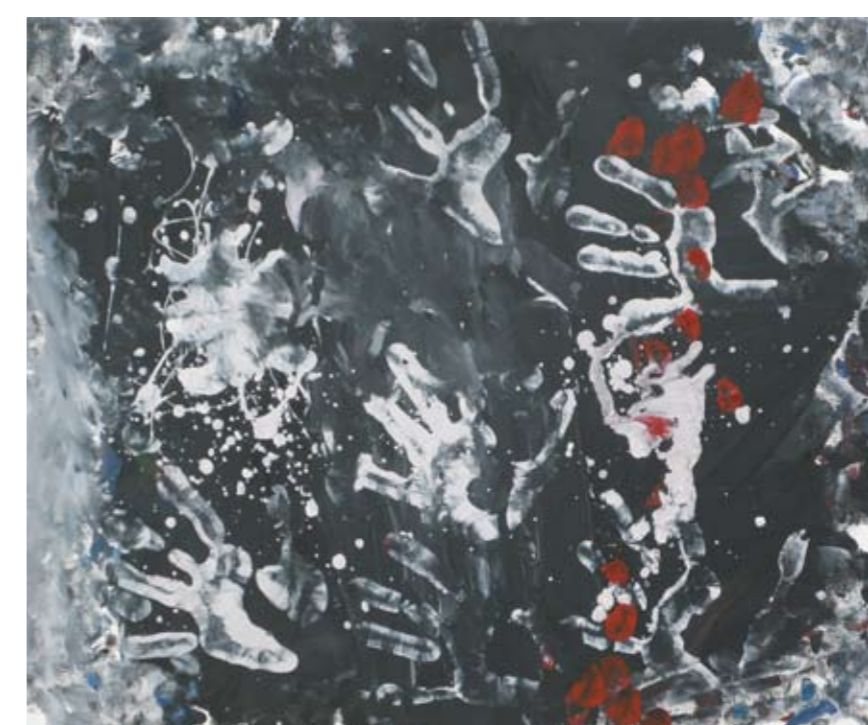
■ Εργαστήριο Ειδικής Επαγγελματικής Εκπαίδευσης και Κατάρτισης Ηρακλείου - Αττικής (ΕΕΕΕΚ Ηρακλείου) / Γυμνάσιο Πόρου / Εργαστήριο Ειδικής Επαγγελματικής Εκπαίδευσης και Κατάρτισης Γαλατά (ΕΕΕΕΚ Γαλατά) / Εκπαιδευτήρια Δούκα ■ Special Vocational and Training Workshops - Iraklio Attikis / Junior High School of Poros / Technical Vocational Educational School of Galatas / Doukas School