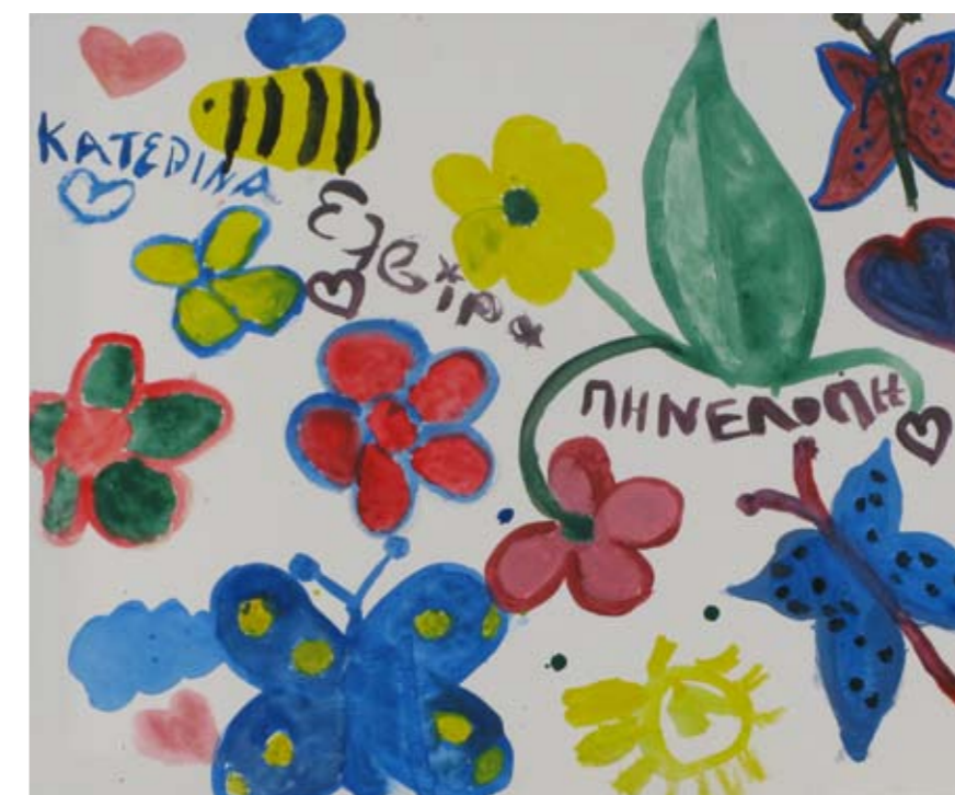
■ ΙΠΕΚΒΕ – Ίδρυμα Πρόνοιας και Εκπαίδευσης Κωφών και Βαρήκων Ελλάδος / Λεόντιο Λύκειο Νέας Σμύρνης / Εργαστήριο Ειδικής Επαγγελματικής Εκπαίδευσης και Κατάρτισης Αγίου Δημητρίου (ΕΕΕΕΚ Αγίου Δημητρίου) / Ελληνογερμανική Αγωγή ■ The Foundation for the Welfare and Education of the Deaf and Hard of Hearing Greece (IPEKVE) / Leontio High School of Nea Smirni / Special Vocational and Training Workshops – Agiou Dimitriou / Ellinogermaniki Agogi