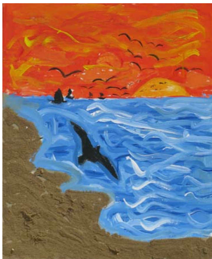
■ Εργαστήριο Ειδικής Επαγγελματικής Εκπαίδευσης και Κατάρτισης Χανίων - Κρήτη (ΕΕΕΕΚ Χανίων) / Γενικό Ενιαίο Λύκειο Ακρωτηρίου ■ Special Vocational and Training Workshops – Chania / General High School of Akrotiti