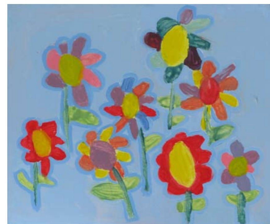
■ Εργαστήριο Ειδικής Επαγγελματικής Εκπαίδευσης και Κατάρτισης Χανίων - Κρήτη (ΕΕΕΕΚ Χανίων) / Δημοτικό Σχολείο Αγίας Χανίων ■ Special Vocational and Training Workshops – Chania / Primary School Agias Chanion